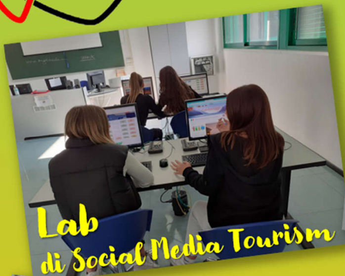
Lab di Social Media Tourism