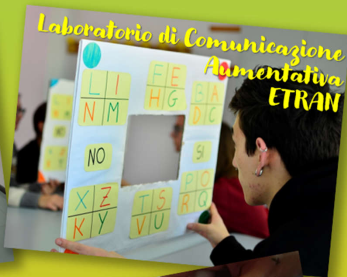
Laboratorio di Comunicazione Aumentativa ETRAN