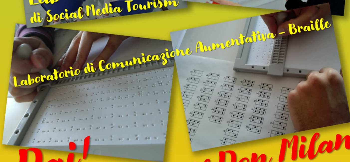
Laboratorio di Comunicazione Aumentativa - Braille